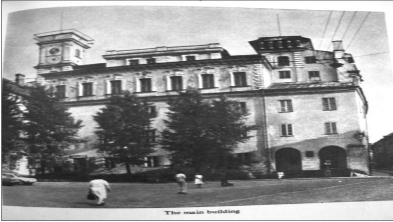
Resim 1: Vilnius Üniversitesi Rektörlük Binası