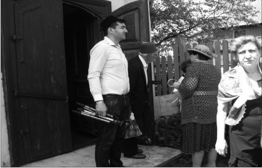
Resim 7: Kenassa'dan Çıkan Karaim Türkleri