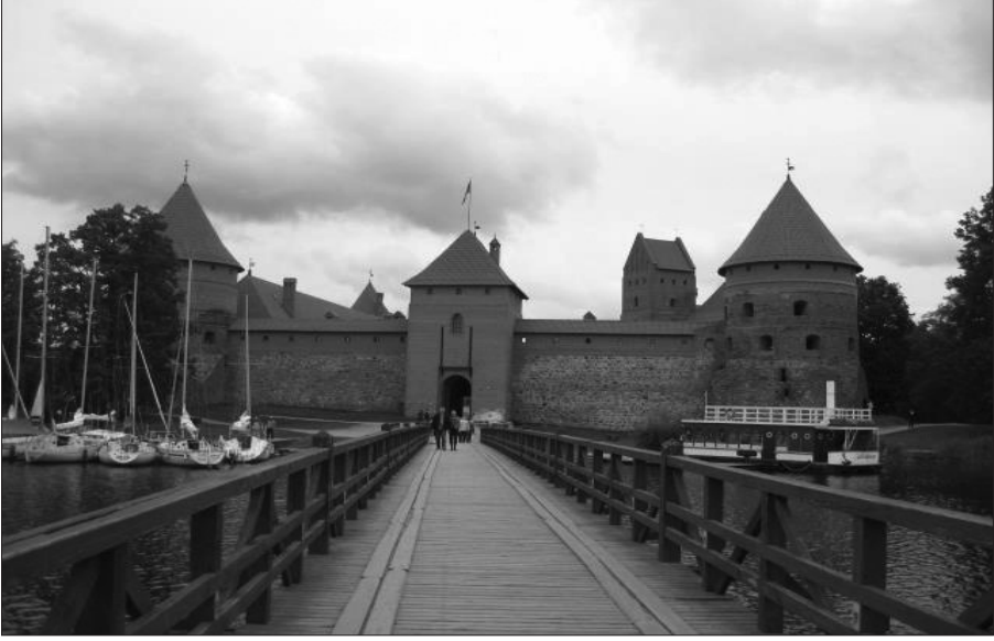
Resim 6: Trakai Kalesi