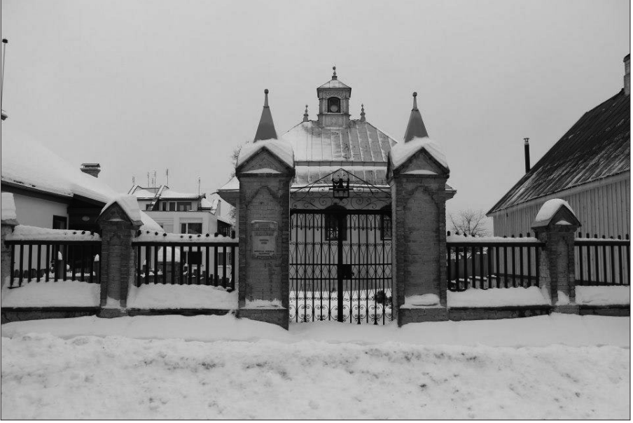
Resim 8: Trakai’de Karaim Türklerinin Kenassa’sı