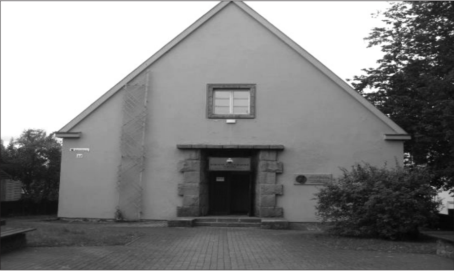
Resim 3: Karaim Türklerrinin Etnografya Müzesi