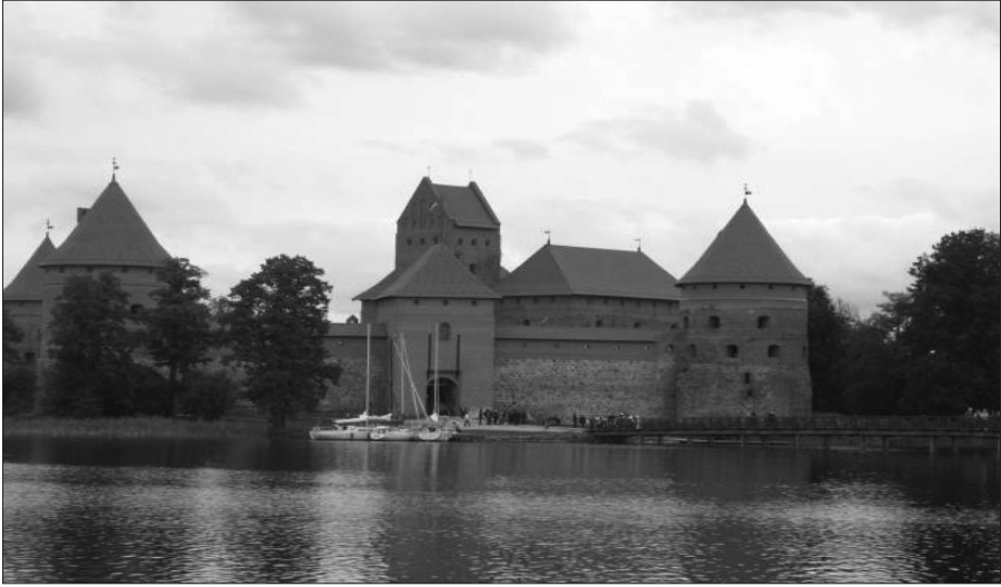
Resim 5: Trakai Kalesi