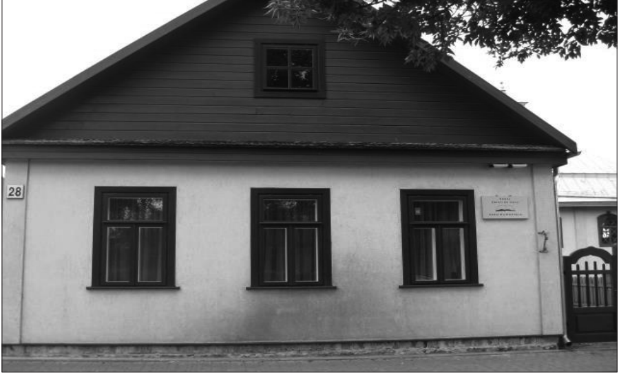
Resim 4: Trakai'de Karaim Türklerinin Okulu 45